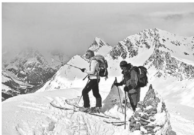
Sur la Tête de Fonteinte

Il faut bien redescendre du paradis, dans la neige tombée dès la nuit, 20 ou 30 cm, va savoir : le vent la chasse à l'horizontale. Ce matin, plusieurs ont défié le Petit-Mont-Mort. Contrôle des Barryvox, départ par groupes échelonnés. Des « invisibles » d'ordinaire, désignés responsables, assu-